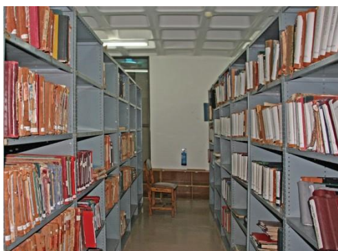
Figure 5, Confirmation, par une mesure ICF, de l'absence d'activité fongique dans un magasin d'archives situé en zone tropicale