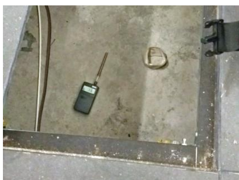
Figure 8, Détection de contaminations fongiques cachées dans une salle d'exposition d'un musée, nécessitant un second nettoyage.

Photographies et document : Stéphane Moularat / © CSTB.