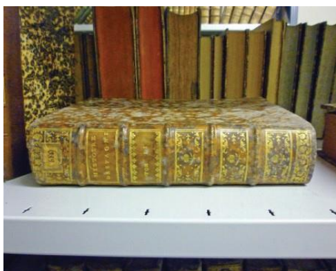
Figures 2 et 3, Cas d'un livre contaminé, retrouvé dans un magasin d'archives

En pratique, cette mesure consiste à réaliser un prélèvement gazeux d'une heure, à l'aide d'une pompe fonctionnant à 150 mL/min. Les échantillons sont ensuite acheminés au laboratoire pour analyse et calcul de l'ICF. Ainsi, il est possible, par une mesure simple, de diagnostiquer une croissance fongique dès le début du développement, y compris sans émission de spores dans l'air, ou encore d'assurer la surveillance d'un environnement vis-à-vis du risque de prolifération fongique.