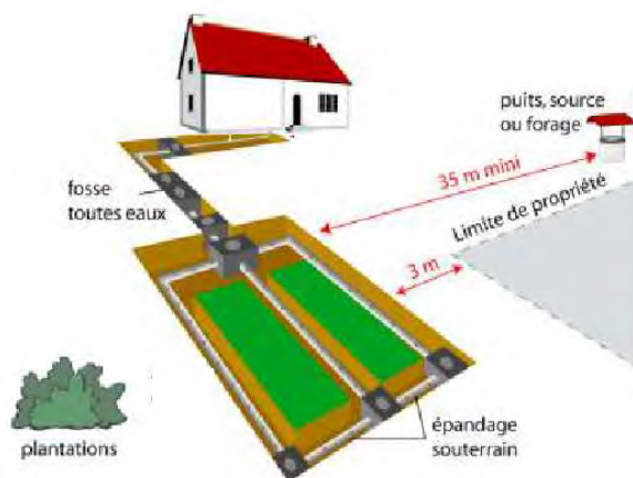
Figure 2 : Ecarts de l'installation sur la parcelle

Les distances sur la parcelle sont à prendre en compte sur le plan réglementaire (distance sanitaire des 35 m, distance du voisinage et de la ventilation secondaire) et sur le plan de la stabilité des ouvrages. Cela concerne à la fois la protection des fondations des bâtiments et celle des ouvrages d'ANC vis-à-vis des racines des arbres et des accès des véhicules pour l'entretien ou le stationnement notamment. Le tableau 9 mentionne les distances minimales entre l'installation (en tout point) et certaines de zones de la parcelle.