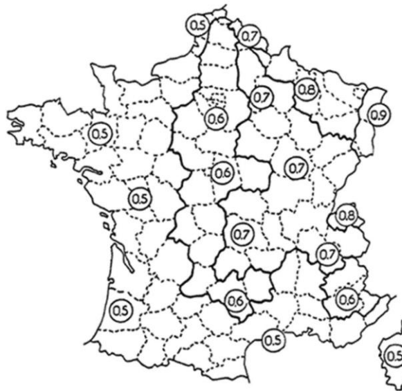
Figure 1 — Carte de gel défini dans le NF DTU 13.11 P1-1.

Dans les zones à gel modéré (référence 05 et 06 de la figure 1 pour le cas de la France hexagonale), il n'est pas a priori envisagé de protection particulière si l'on respecte les exigences fixées dans le DTU 64.1, les DTA/ATec (sans mention particulière sur le gel).