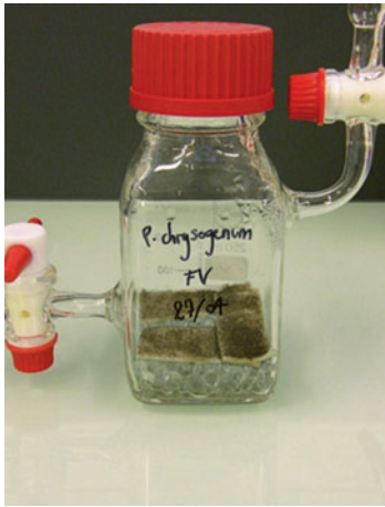
◀ Figure 2. Une chambre contaminée après 35 jours d'incubation.

loppe préférentiellement sur du papier contenant de la lignine, contrairement à A. versicolor et P. chrysogenum , et les croissances de A. restrictus et P. chrysogenum sont anti-corrélées.