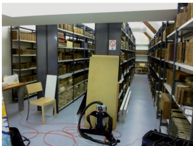
▼ Figure 3. Magasin 1 de la médiathèque de Château-Thierry, et schéma des points de prélèvement à 1,5 m (A, B, C), au plafond (B, C) et au sol (C) dans le magasin.

À l'issue du programme de recherche DECAGRAPH, une liste de COVm cibles spécifiques d'une contamination fongique des collections papier a pu être établie, et un indice de contamination spécifique, calculé. La présence effective d'une partie de ces COVm cibles a été confirmée dans tous les magasins de conservation contaminés retenus pour ce projet. Combinée à l'utilisation de l'ICF, la détection de ces COVm cibles pourra dorénavant être utilisée pour mettre en place une stratégie de surveillance de l'état sanitaire des collections de bibliothèques et d'archives en particulier. Dans cette optique, un prototype de capteur autonome adapté aux lieux d'habitation a d'ores et déjà été développé pendant toute la durée du projet DECAGRAPH dans le cadre d'une thèse, soutenue par Y. Joblin en septembre 2011 [5]. Une amélioration et une miniaturisation du prototype sont à l'étude et nous espérons une commercialisation pour les années à venir. On retiendra que parmi les COVm émis par les moisissures cellulolytiques sélectionnées