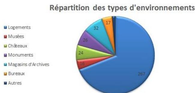
Figure 1 : Distribution des différents types d'environnements ayant servi à la validation de l'ICF

Afin de valider l'indice, les analyses de 387 environnements ont été utilisées. La Figure 1 recense les différents types d'environnements employés pour caractériser l'indice.