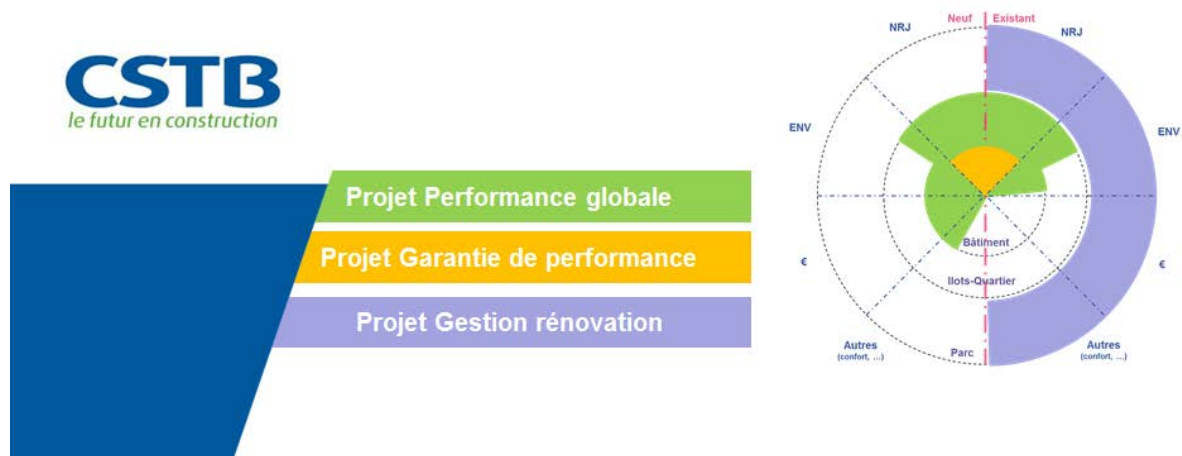
Figure 3 : Structuration de la priorité "Energie Environnement" et illustration du positionnement des projets de recherche en regard des échelles d'intégration (bâtiment, îlot, quartier, parc) et thématiques (énergie, environnement, économie, confort, ...)